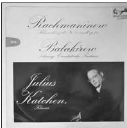
Mily Balakirew's "Islamey" Julius Katchen 1959 Decca CD

sprechers, seid ihr raus aus dem Spiel. Es ist schlechterdings nicht möglich hier mitzureden, wenn man die Performance eines solchermaßen basspotenten Lautsprechers nicht einmal erahnen kann. Der Nachhall des gewaltigen Klangkörpers wabert durch die riesige Kirche, und das wirft mir die Speakerheaven absolut überzeugend in die eigenen vier Wände. Es klingt so echt, dass ich beinahe glaube, die Zusammensetzung des Lötzinns riechen zu können.