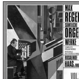
Max Reger Rosalinde Haas Ein feste Burg, op. 27 MDG CD, 1989

Zur vertracktesten Rhythmik der gesamten Klavierliteratur zählt ohne Zweifel Mily Balakirev's "Islamey". Wer das ohne Sehnen-scheidenentzündung und/oder Suizidgedanken hinbekommt, der ist meines Respektes