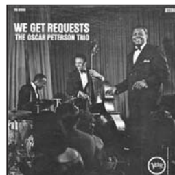
We get requests Verve CD, 1964