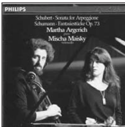
Arpeggione Sonate von Franz Schubert Misha Maiskys Cello Martha Argerichs Flügel Philips CD, 1984